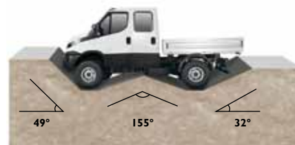
Böschungswinkel vorne Rampenwinkel Böschungswinkel vorne